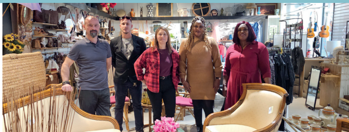
Centre commercial Les Quatre Saisons - Meaux 77

La Ressourcerie Éphémère a ouvert le 4 novembre au centre commercial Les Saisons de Meaux. Après des mois de préparation, une sélection d'objets uniques a été mise en valeur. Ce projet, porté dans le cadre du mois de l'ESS, promeut le réemploi et offre aux salariés une immersion professionnelle.