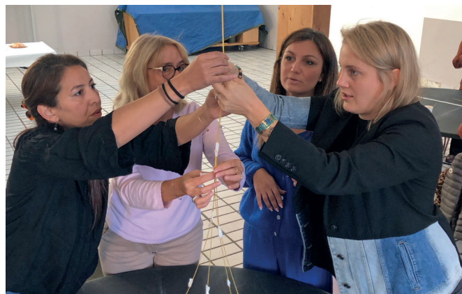
Séminaire Cadres sur le thème « cohésion d'équipe »

« L'excellence n'est pas un objectif, c'est un cheminement. Elle n'est atteignable que si nous agissons ensemble, avec une vision claire et une mise en œuvre rigoureuse. »