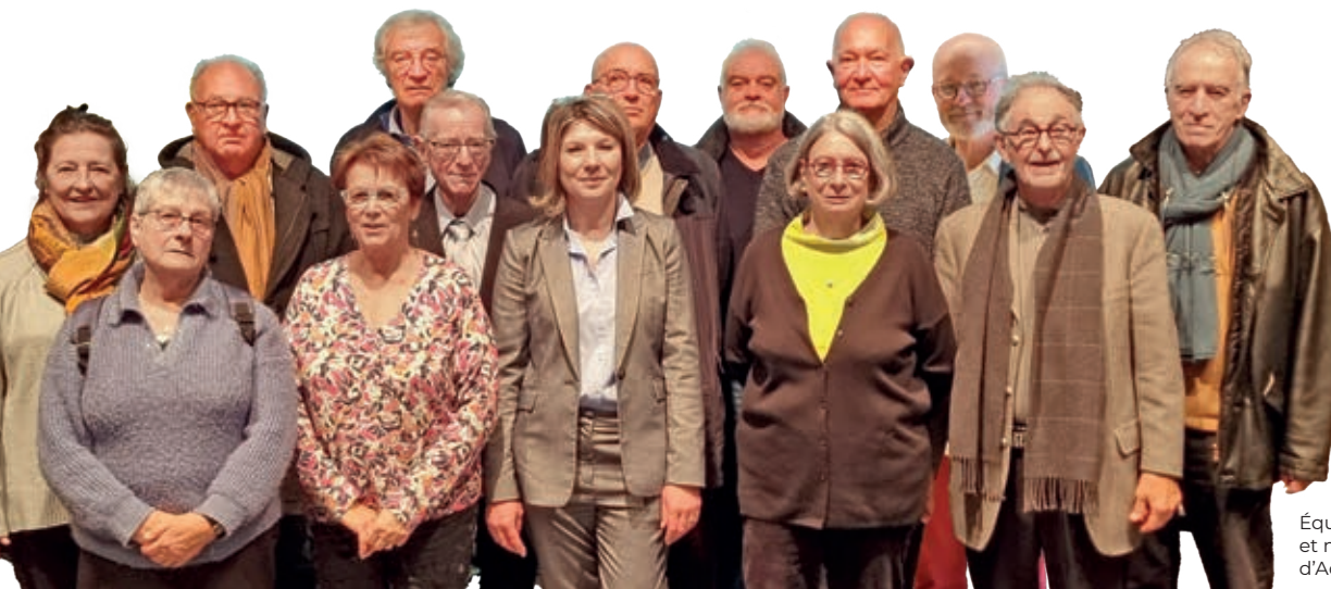
Équipe de Direction et membres du Conseil d'Administration