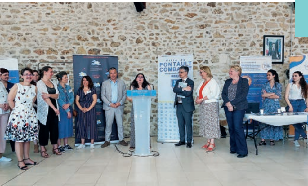
Forum d'inauguration du Révif avec l'ensemble des partenaires - 6 juin 2023.