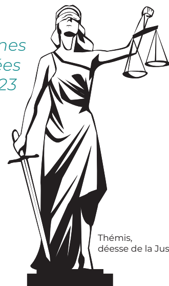
Thémis, déesse de la Justice.