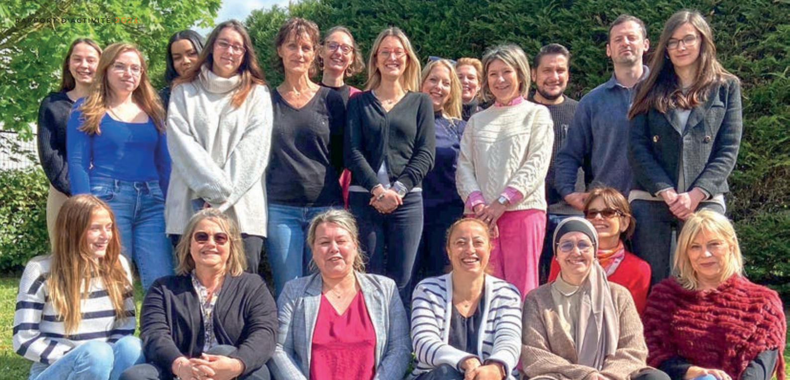
L'équipe support Siège à Magny-le-Hongre.